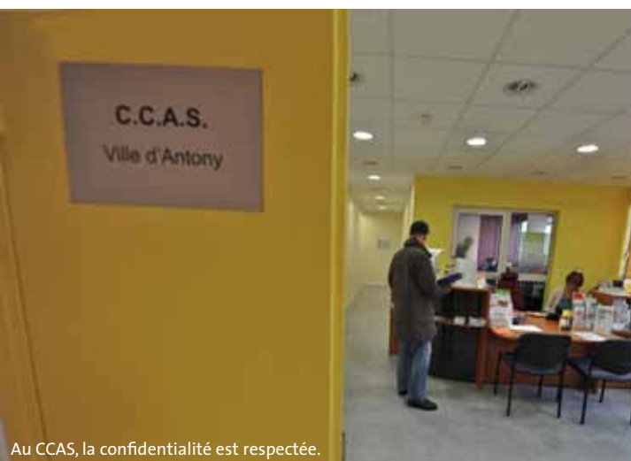
Au CCAS, la confidentialité est respectée.

Ces aides consistent essentiellement en des demandes de carte d'invalidité et de cartes Améthyste, de prestation de compensation du handicap, de RMI, de participation financière à un placement en maison de retraite, d'Allocation Spéciale Vieillesse, d'aide médicale de l'État... Plus de 3 000 dossiers par an sont ainsi suivis par les agents du CCAS. ○