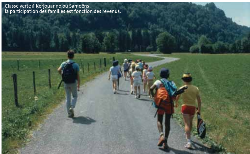
Classe verte à Kerjouanno ou Samoëns : la participation des familles est fonction des revenus.

Divorce, séparation, décès, longue maladie, chômage... Pour vous aider à faire face à une situation difficile, la Ville réactualise à tout moment le tarif de vos prestations. Vous devez informer la Régie Centrale de votre nouvelle situation familiale. Votre dossier sera alors réexaminé et la mise à jour de la tarification s'appliquera le 1 er du mois suivant la déclaration de votre changement de situation.