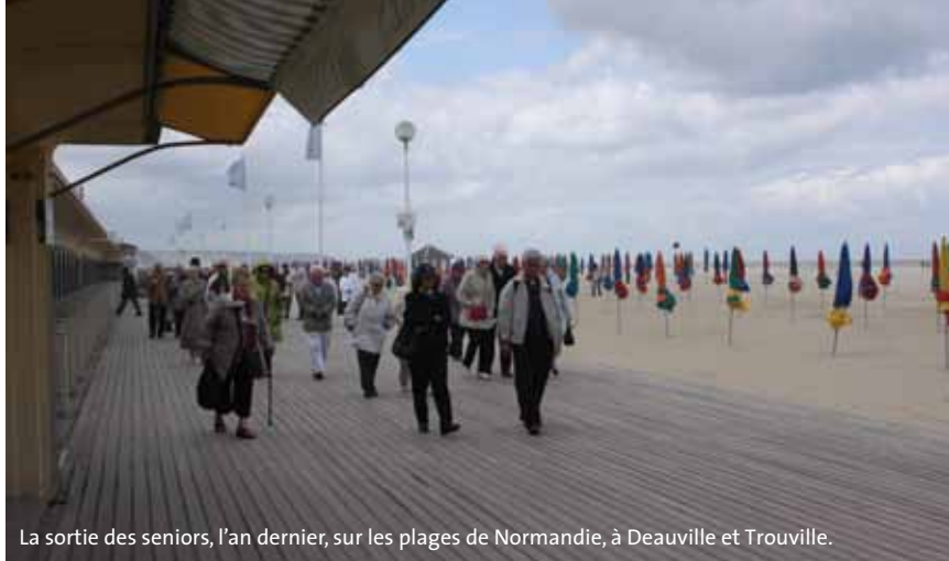
La sortie des seniors, l'an dernier, sur les plages de Normandie, à Deauville et Trouville.

(+ de 80 % d'invalidité), dans le respect de la dignité de chacun.