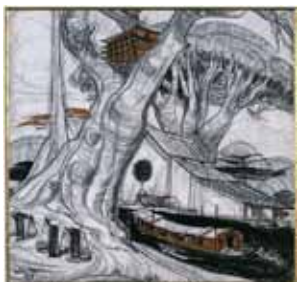
Sur les bords du Mékong, Vietnam 1957.

À partir du 13 février, la Maison des Arts propose une exposition d'œuvres du peintre français André Maire. Un homme qui a puisé son inspiration au fil de ses nombreux voyages.