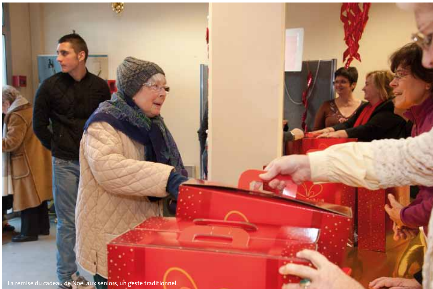
La remise du cadeau de Noël aux seniors, un geste traditionnel.

La Ville d'Antony veille particulièrement au bien-être de ses aînés et développe de nombreuses actions pour les accompagner au quotidien.