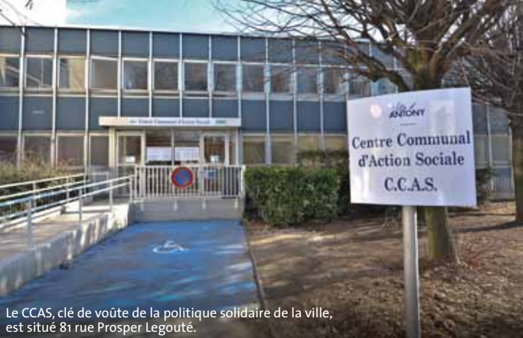
Le CCAS, clé de voûte de la politique solidaire de la ville, est situé 81 rue Prosper Legouté.