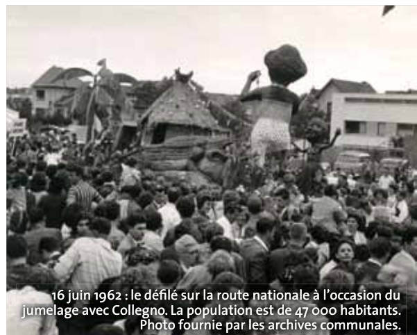
16 juin 1962 : le défilé sur la route nationale à l'occasion du jumelage avec Collegno. La population est de 47 000 habitants.

mique. Mais les années 50 représentent un nouveau bond démographique, baby-boom oblige : les immeubles collectifs et les « grands ensembles » sont construits sur les terrains libres. Alors que les lotissements s'implantaient auparavant le long des rues, les résidences créent de véritables enclos dans la ville où se répartissent habitants, parkings et espaces verts. Les années 60-70 sont marquées par la construction de logements HLM sur le même principe d'immeubles hauts. Résultat, la population explose, passant de 24 500 habitants en 1954 à 56 638 en 1968 ! Puis elle va se stabiliser, augmentant de moins de 1% par an (avec même une baisse entre 1975 et 1982). Antony comptait 61 793 habitants en 2010, se situant comme la 81 e ville de France. ●