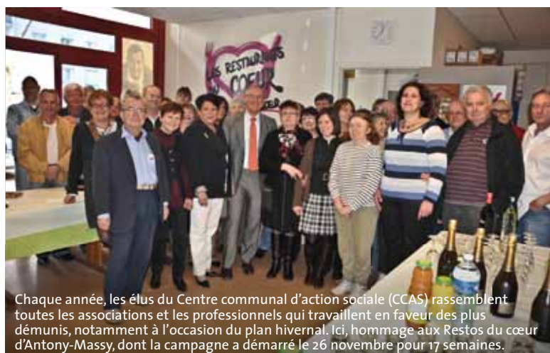
Chaque année, les élus du Centre communal d'action sociale (CCAS) rassemblent toutes les associations et les professionnels qui travaillent en faveur des plus démunis, notamment à l'occasion du plan hivernal. Ici, hommage aux Restos du cœur d'Antony-Massy, dont la campagne a démarré le 26 novembre pour 17 semaines.