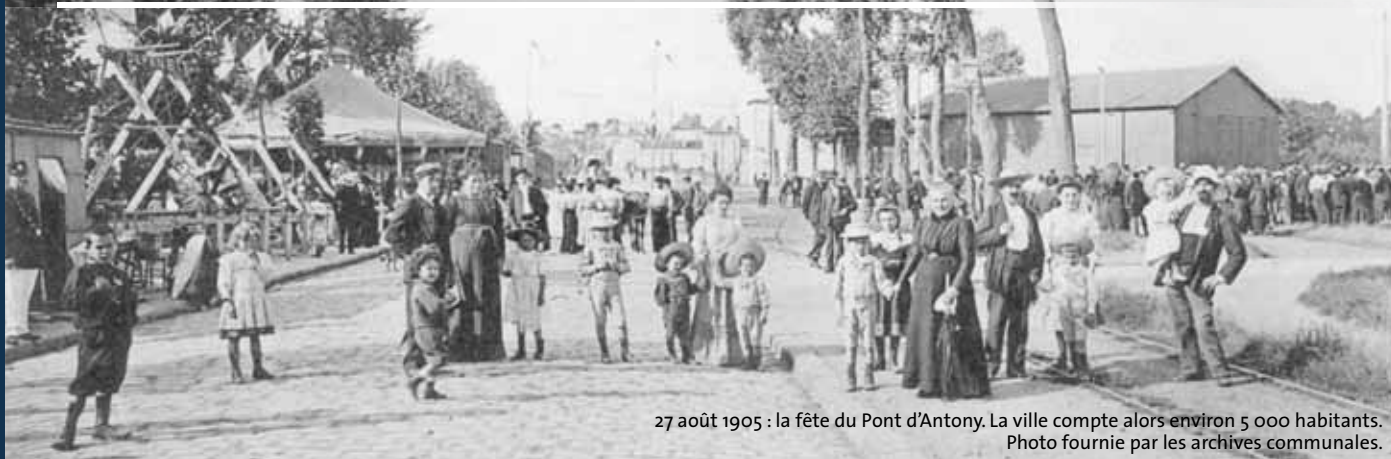
27 août 1905 : la fête du Pont d'Antony. La ville compte alors environ 5 000 habitants.