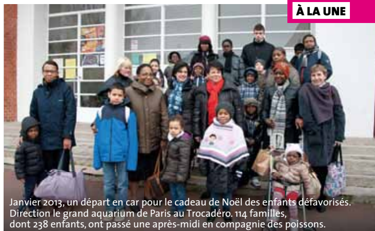
Janvier 2013, un départ en car pour le cadeau de Noël des enfants défavorisés. Direction le grand aquarium de Paris au Trocadéro. 114 familles, dont 238 enfants, ont passé une après-midi en compagnie des poissons.