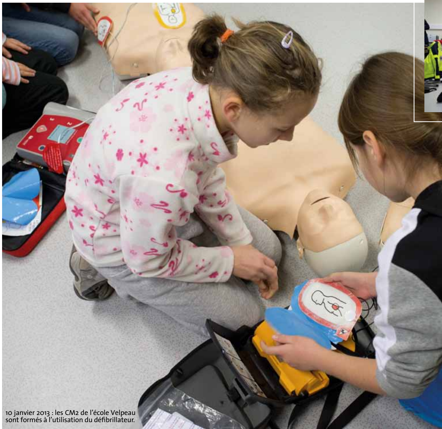
10 janvier 2013 : les CM2 de l'école Velpeau sont formés à l'utilisation du défibrillateur.