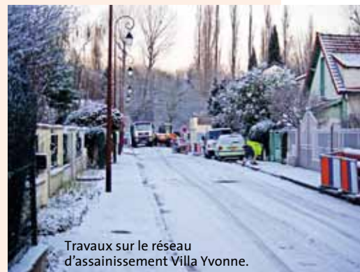
Travaux sur le réseau d'assainissement Villa Yvonne.

Le Conseil général du 92 poursuit la requalification de l'avenue Raymond Aron et du carrefour de l'Europe. La Cahb réhabilite le réseau d'assainissement de la rue Léonie et de la Villa Yvonne. Enfin, le Sipperec poursuit jusqu'à mai son programme d'enfouissement des réseaux aériens de distribution publique d'électricité et de télécommunications électroniques. Sont concernées les rues des Glaises, du Clos de Massy, du Saule, des Jardinets, Camille Pelletan, de Massy, des Lilas, des Acacias, des Garennes, des Chênes, du Docteur Barié, Pierre Vermeir, les av. Arouet, d'Alembert, de la Duchesse du Maine, de la Marquise du Deffand, le Chemin Latéral, la place des Anciens Combattants d'Afrique du Nord, le passage Grillot. Veolia Eau Île-de-France renouvelle les canalisations d'eau potable rue René Roedel.