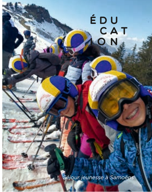
Séjour jeunesse à Samoëns

1, allée Martin-Luther-King et 4, rue Robert-Scherrer Inscriptions : 01 40 96 68 35